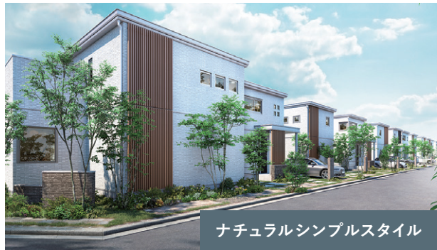
ナチュラルシンプルスタイル