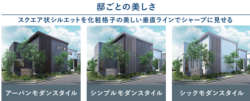
アーバンモダンスタイル